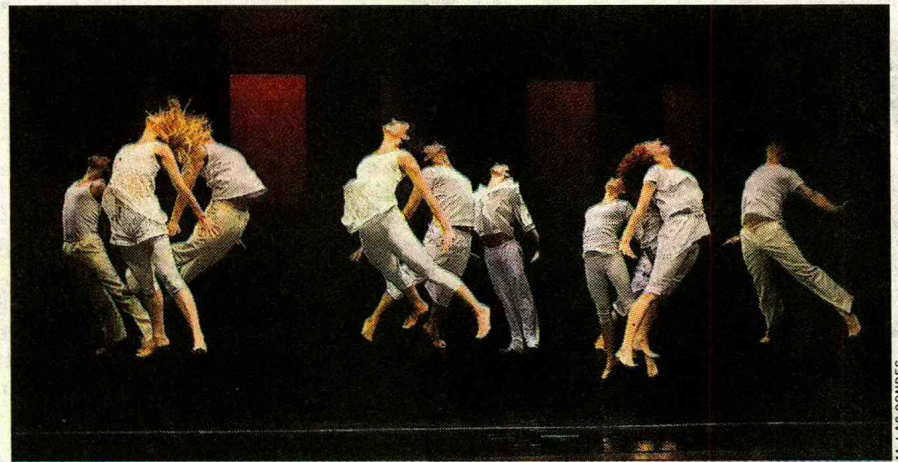
DANZA. — El festival "Danza en Las Condes" reunirá a las compañías más importantes del país. La muestra es hasta el 14 de enero en la Casona Santa Rosa de Apoquindo.

Además de los tradicionales talleres deportivos y culturales, algunas comunas de Santiago organizaron festivales y viajes para sus vecinos.